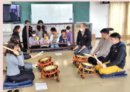
摺鉦、太鼓、龍笛の三楽奏でした