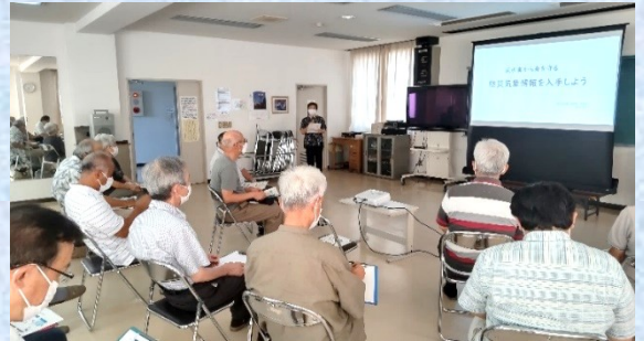
開催にあたり杉本部長からの挨拶

5 段階の警戒レベルの説明や気象庁のサイトから雨雲の動きの情報の取り方、伊賀市防災・情報アプリ(ハザードン)等を詳しく説明頂きました。上野西部地区は比較的 안전한地域であり、内水氾濫も垂直避難(高層階への避難)で移動距離を減らすことも重要である等、認識を新たに得た講演会でした。