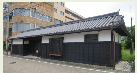
成瀬平馬家長屋門

(仮称) 忍者体験施設の工事説明会が 9 月 14 日上野西部地区市民センターにて行われました。場所は上野西丸之内の成瀬平馬家長屋門の北側空き地に建設されるとのことで今年 11 月から本格工事に着工の予定と説明がありました。大型の工事車両は上野市駅駅舎の南側にある伊賀鉄道(株)の通路を利用し、成瀬平馬家長屋門南面の道路の使用は少ないと説明されました。開業は令和 6 年 11 月予定だそうです。開業後については伊賀の街を徒歩で回るルートを作成するなど歩いてもらえるような回遊のしくみを作りたいとの話がありました。