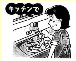
流し場のヌメリが取れます