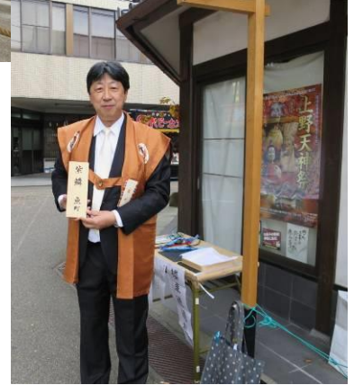
右写真、下写真 朝 7 時、菅原神社裏新町角でだ んじりの順を確認する札を取 る町の代表者