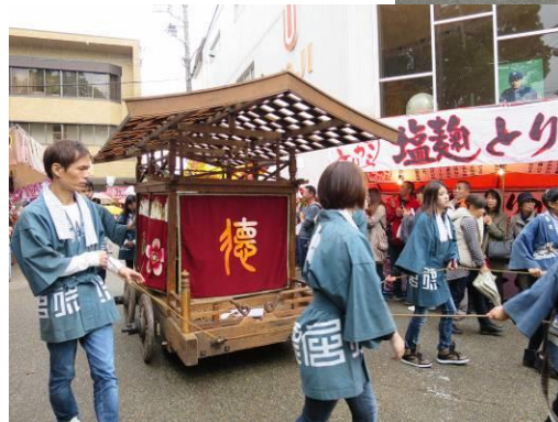
左 復元修繕された 徳居町の太鼓台