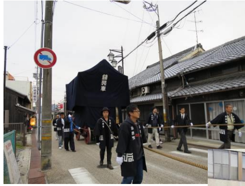
左写真 朝 7 時ごろ上野 車坂町内に向う だんじり

また今月末頃には全国 33 の山・鉾・屋台行事（お祭り）と一緒にユネスコの無形文化遺産に登録される予定でありより一層注目度を上げることが期待されています。