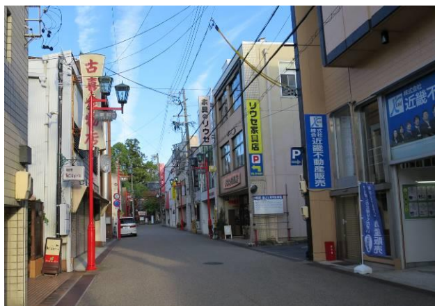
塗り替えた街路灯

のエリアは既に最高速度は30キロに制限されており通常の生活に大きな変化はないようです。