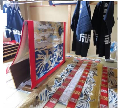
集議所に並べられた幕と法被