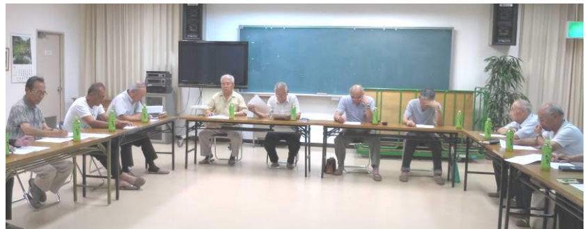
自治会特別部会の様子

＊消防団夏季訓練について 8月7日の夏季訓練について訓練への一部参加について依頼と説明がありました。