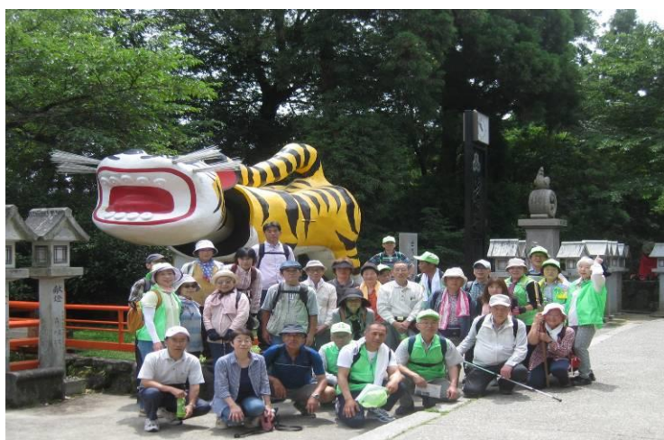
参加された皆様 信貴山朝護孫子寺にて