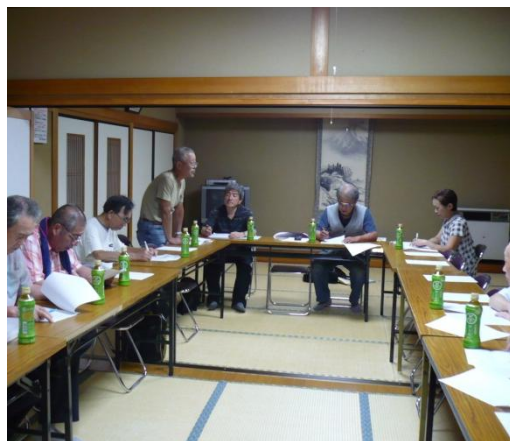
上の写真 部会の様子