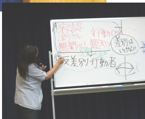
人権大学講座の様子