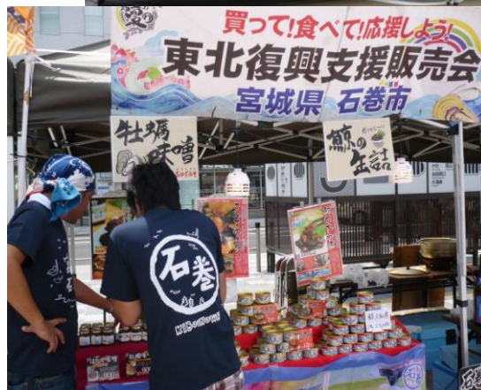
駅前でのステージと屋台村