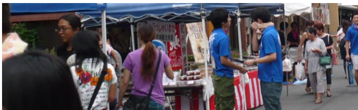
三つの写真 楽市楽座の様子