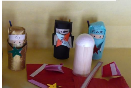
↑ 上野中町の沖森邸で実施されている忍者こけしの制作。写真は完成品と材料キット