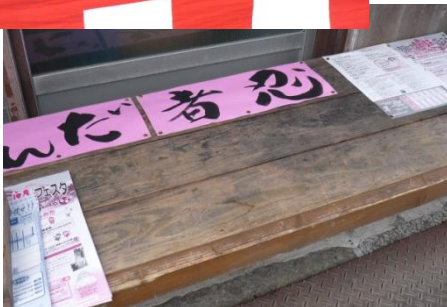
↑ 上野小玉町にあった休憩ベンチ