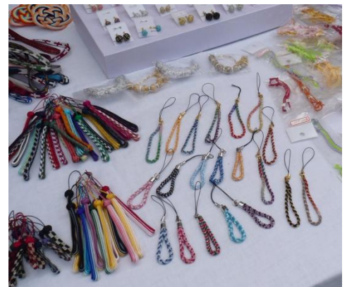
↑ 上野西町の民家の駐車場前に並ぶ組みひもの小物。何うと「全然商売にはなりません。観光客の皆さんに忍者道場の場所を良く尋ねられます。道案内係です。」と笑われました。