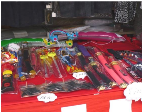
← 上野紺屋町の洋品店の店先に並ぶ玩具類