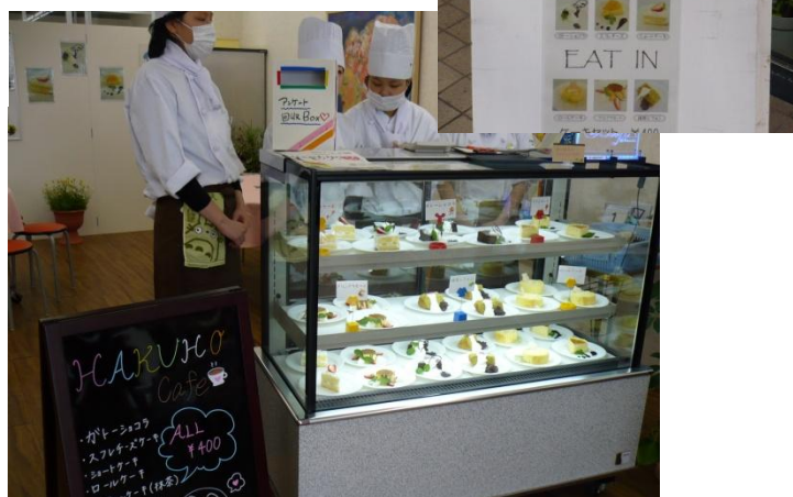
高校生ショップ 店内の様子

4月20日(土)21日(日)上野東町のうえせん白鳳プラザにて伊賀白鳳高校の高校生ショップが開店しました。ケーキ・クッキー・ジャム等が販売され、Ninja フェスタ期間でもあり、観光客などでたいへん賑わいました。報道関係の方も多く訪れ、新聞等で掲載され注目を浴びました。