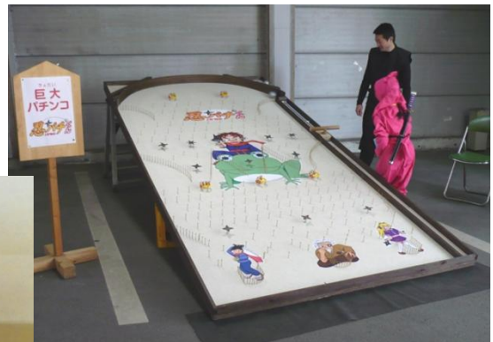
↑ 信用金庫さんの駐車場をお借りして行われている巨大パチンコゲーム

5月6日(月)までNinjaフェスタが行われ、多くの観光客が私達の地区を訪れています。今号は町のあちこちで行われているおもてなし等取材しました。