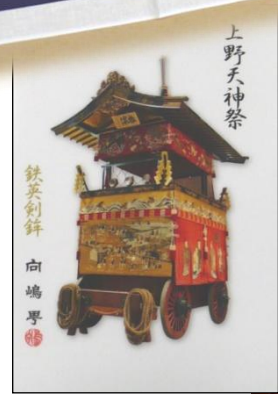
向島町のクリアファイル