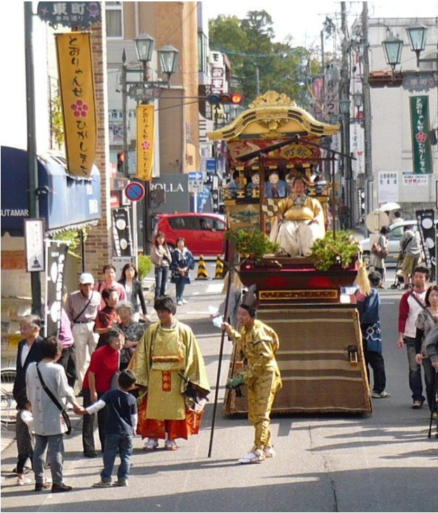
本町通りで行われた展示の様子

全国山・鉾・屋台保存連合会の総会が10月15日(土) ヒルホテルサンピア伊賀にて開催されました。翌16日は本町通りに6町のだんじりと印そして鬼行列が並び、全国からの総会参加者の他たくさんの市民で賑わいました。ミニ巡行も実施され一足早いお祭りムードが盛り上がりました。