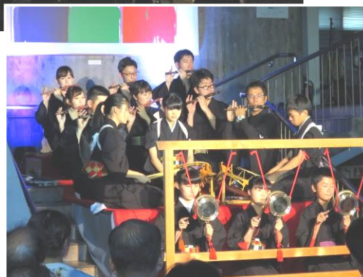
上 伊賀上野城 右 二東社の演奏