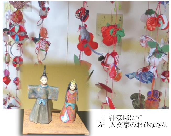
上 沖森邸にて 左 入交家のおひなさん

2月20日から西部地区を中心に「伊賀上野 城下町のおひなさん」が始まりました。本町通りや中之立町通りの商店や民家におひなさんが飾られ、周辺の公共施設等でいろんなイベントや展示が行われています。晴天となった21日(日)、通りはチラシを持って散策する観光客が続き一挙に春の装いとなりました。