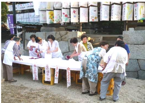
天神さんの夏祭り 敬神婦人会バザー