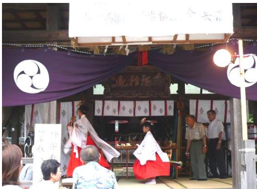
あたごさんのおまつり