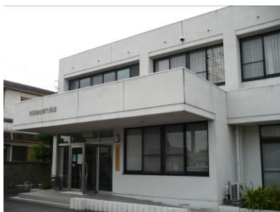
西部地区市民センター

地域のことは、そこに住む人が一番良く知っています。こんな地域にしたいという自分たちの夢を最も適切なやり方で実現する方法を知っているのは私達です。近所で何か困っていることがある時、まず自分たちで何が出来るか考えてやってみる。必要なら行政と協力して問題を解決していく。そうすることで皆さんの町や上野西部地区が住みやすくなり、地域への愛着が増し、地域全体の価値を高めていくことが出来ます。