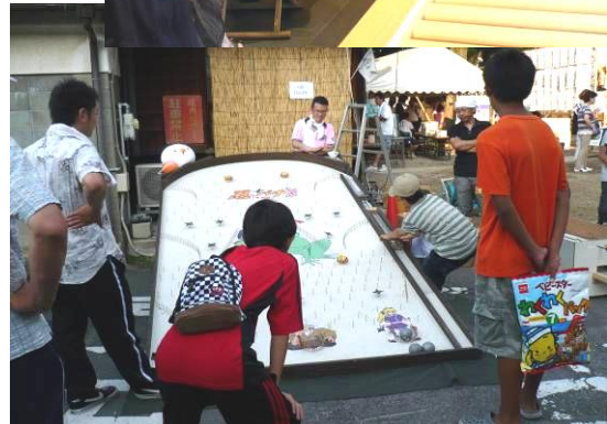
天神さんの夏祭 巨大パチンコ